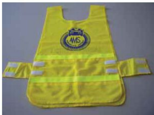
Слика 94. Свјетлоодбојни (флуоросцентни) прслук

Када се крећу коловозом на јавном путу ван насељеног мјеста, ноћу и дању у условима смањене видљивости, пјешаци морају бити означени свјетло-одбојним прслуком (слика 94).