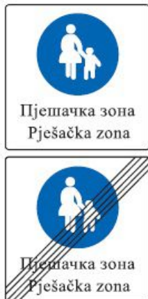
Слика 90. Саобраћајни знакови “почетак и завршетак пјешачке зоне”

Пјешачке зоне се обилежавају одговарајућим саобраћајним знаком „Пјешачка зона“, као и знаком „Завршетак пјешачке зоне“.