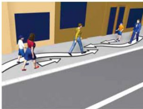
Слика 87. Кретање пјешака тротоаром

Тротоар је посебно уређена саобраћајна површина намијењена за кретање пјешака, која није у истом нивоу с коловозом пута, или је од коловоза одвојена на други начин (слика 87).