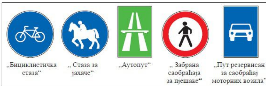
Слика 92. Саобраћајни знакови који означавају саобраћајне површине по којима се не смију кретати пјешаци

На аутопуту, брзом путу и путу резервисаном за саобраћај моторних возила забрањено је кретање пјешацима.