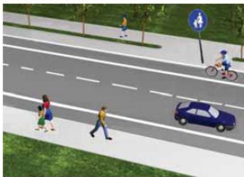
Слика 88. Пјешачка стаза

Пјешачка стаза је посебно изграђена саобраћајна површина по којој се пјешаци морају кретати. На пјешачким стазама пјешаци се крећу безбједно. Стаза је означена саобраћајним знаком обавезе (слика 88).