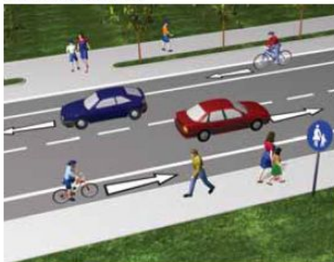
Слика 86. Површине намјењене за кретање возила и пјешака

Пјешаци су лица која учествују у саобраћају а не управљају возилом, нити се превозе у возилу или на возилу. Пјешаци су и лица која властитом снагом гурају или вуку возило, ручна колица, бицикл, мопед, дјечија колица или покретна колица за немоћна лица. Пјешаци су и лица у покретној столици за немоћна лица коју покрећу властитом снагом или снагом мотора, ако се при томе крећу брзином човјечијег хода. Такође, пјешаци су и лица која клизе клизаљкама, скијама, санкама или се возе на котураљкама.