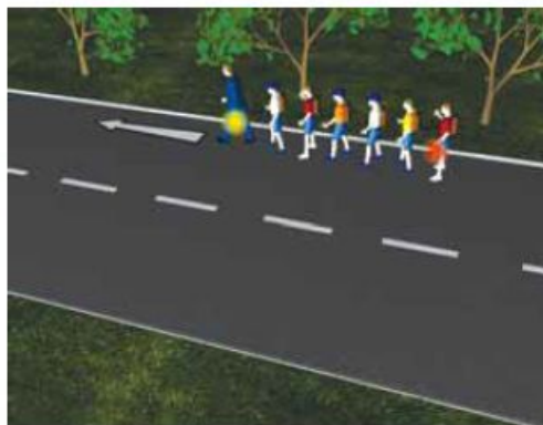
Слика 95. Кретање организоване колоне пјешака ноћу