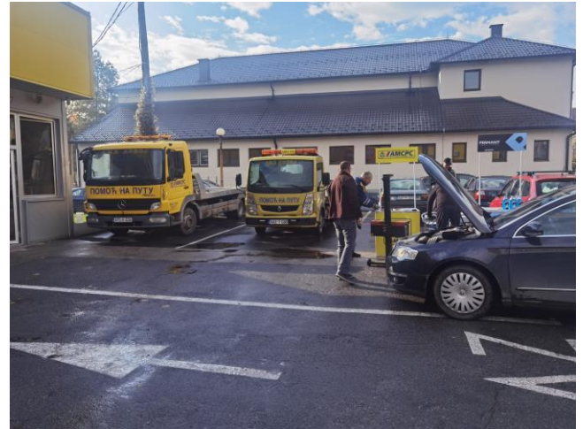
Слике 3. и 4. Преглед возила на контролним пунктовима у Сокоцу и Добоју