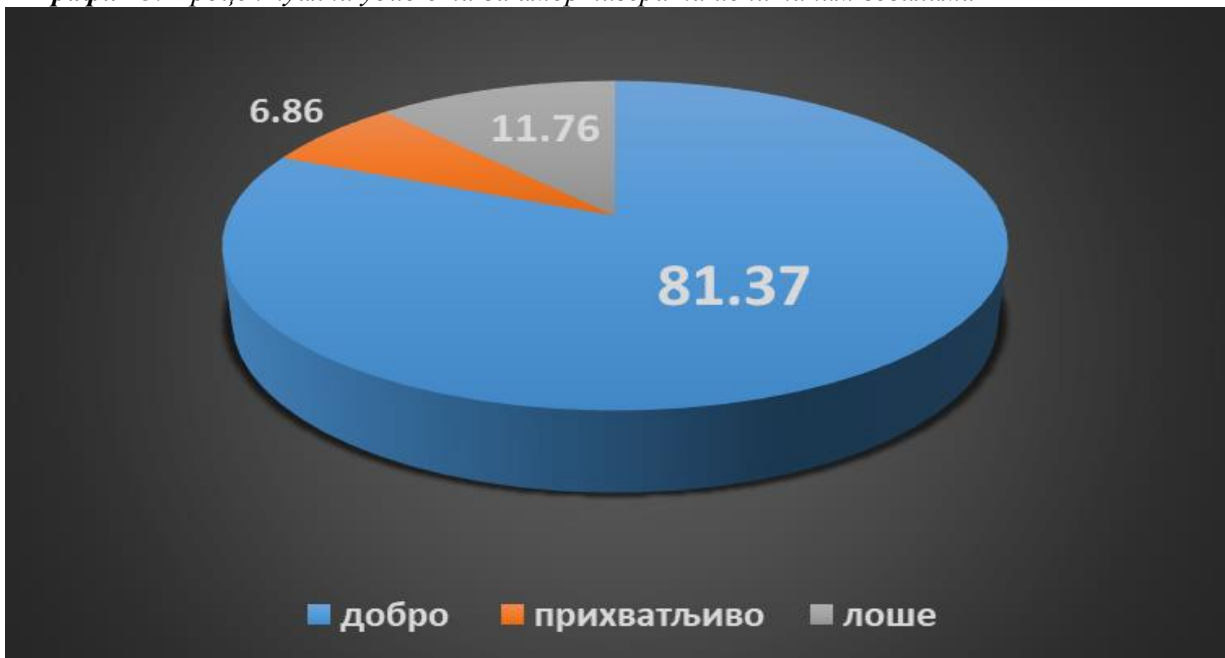
График 3. Процентуални удио стања амортизера на испитаним возилима

Поред истрошености амортизера, неисправношћу се такође сматра и када разлика између амортизера на истој осовини износи више од 25 процената, што је такође уврштено у наведене податке. Потребно је напоменути да је у случају неисправности једног амортизера, ипак потребно промјенити оба амортизера на истој осовини, како би силе које дјелују на оба точка биле једнаке.