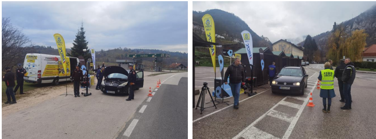
Слика 5. и слика 6. Преглед возила на контролним пунктовима у Мркоњић Граду и Вишеграду

Преглед плинске инсталације је извршен на 55 возила, од чега је код 3 возила утврђено да постоји цурење плина на појединим спојевима, док је код 52 возила инсталација била у потпуности исправна. Возачима је скренута пажња на то да обавезно посјете сервис и уклоне утврђени проблем.