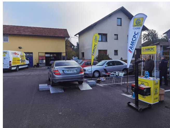
Слика 1. и 2. Провођење превентивне активности у Прњавору и Козарској Дубици

Анализом резултата утврђено је да код 93 (11,85%) контролисана возила свјетлосно сигнални уређаји не испуњавају захтјеве за безбједно учешће у саобраћају, а нарочито у зимском периоду.