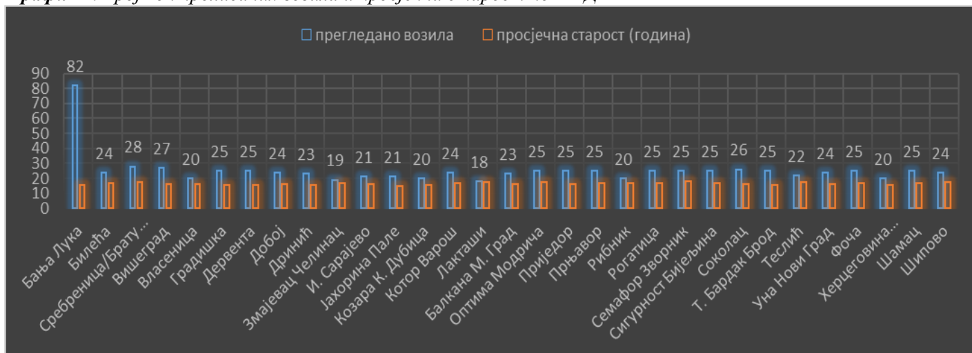
График 1. Број контролисаних возила и просјечна старост по АД

Из табеле 1. видимо да је на терену укупно прегледано 785 возила, просјечне старости 16,50 година, као и колико је укупно возила прегледано на свакој појединачној локацији.